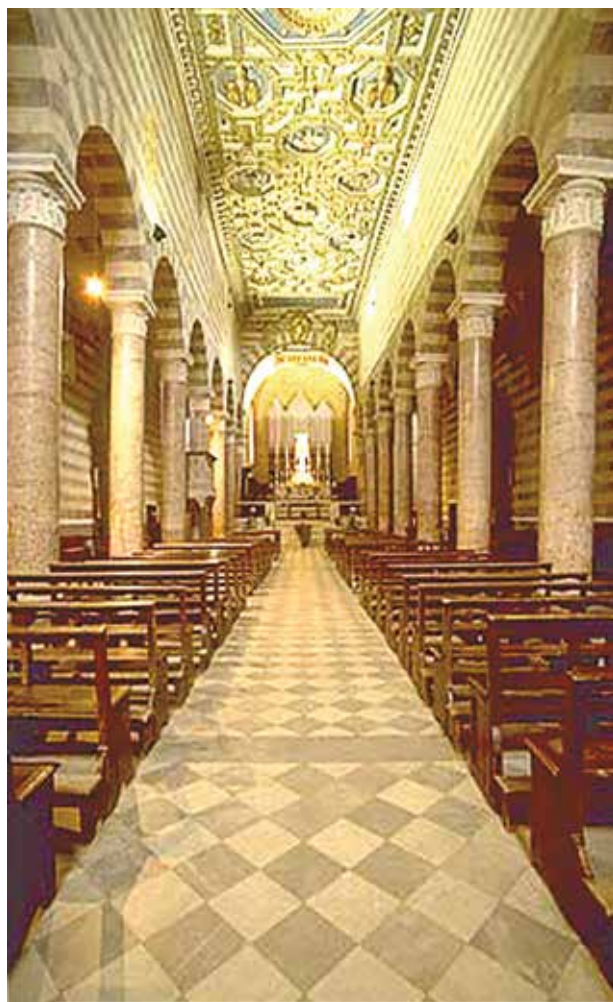
Intérieur de la cathédrale

En 1472 pendant la guerre entre Volterra et Florence, un soldat florentin, entré dans la cathédrale de Volterra, réussit à s'emparer du précieux ciboire en ivoire contenant plusieurs hosties consacrées. Dès qu'il fut sorti de l'église, pris par un mouvement de colère envers Jésus, il jeta le ciboire avec son précieux contenu contre une paroi de l'église. De la paroi toutes les hosties consacrées éclairées d'une lumière mystérieuse, s'élevèrent miraculeusement et restèrent longtemps suspendues.