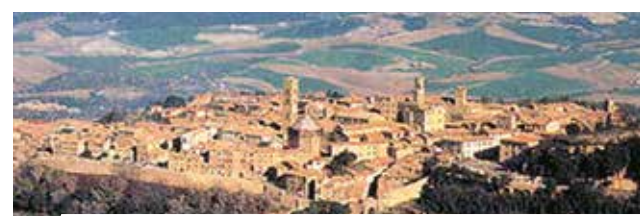
Vue de Volterra