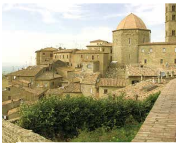
Panorama de la ville