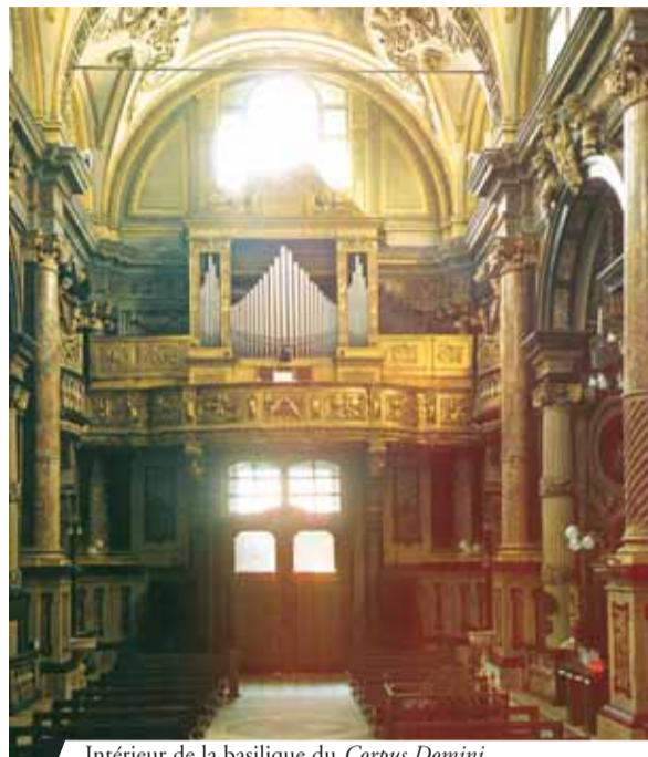
Intérieur de la basilique du Corpus Domini

Dans la basilique du Corpus Domini à Turin, il existe une grille en fer qui entoure l'emplacement où eut lieu le premier miracle eucharistique en 1453. Une inscription sur le pavement à l'intérieur le décrit en ces termes : « Ici tomba prostré le mulet qui transportait le Corps divin ; ici la Sainte Hostie libérée du sac qui l'emprisonnait s'éleva d'elle-même ; ici, clémente elle descendit dans les mains suppliantes des Turinois – ici donc est le lieu devenu saint par ce miracle – en le rappelant, en le priant à genoux, qu'il soit par toi vénéré ou qu'il t'inspire de la crainte (6 juin 1453) ».