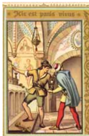
Représentations du miracle de Turin