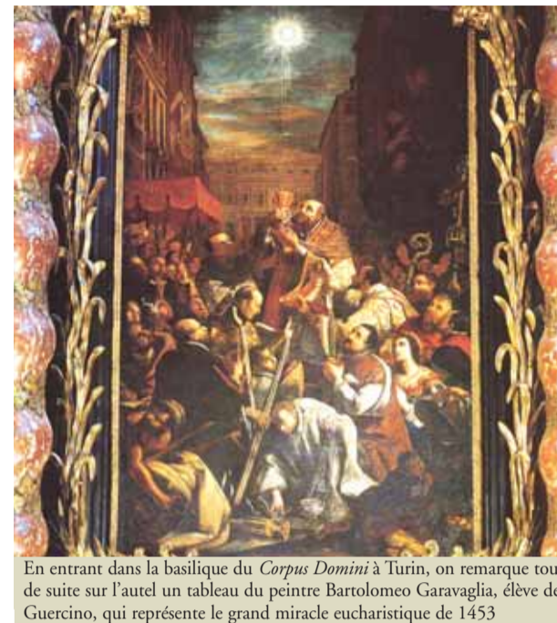
En entrant dans la basilique du Corpus Domini à Turin, on remarque tout de suite sur l'autel un tableau du peintre Bartolomeo Garavaglia, élève de Guercino, qui représente le grand miracle eucharistique de 1453