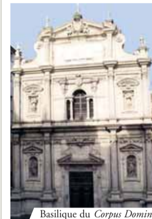
Basilique du Corpus Domini , Turin