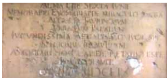
Plaque commémorative du miracle, Turin