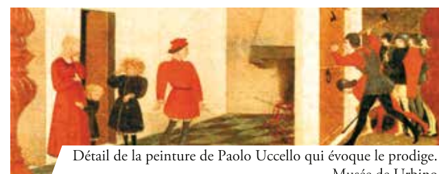
Détail de la peinture de Paolo Uccello qui évoque le prodige. Musée de Urbino