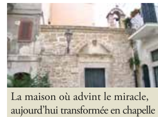
La maison où advint le miracle, aujourd'hui transformée en chapelle