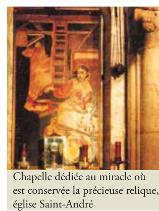
Chapelle dédiée au miracle où est conservée la précieuse relique, église Saint-André