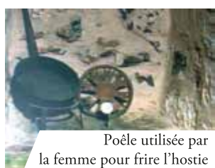
Poêle utilisée par la femme pour frire l'hostie

PADRE PIO DISSE: "TRANI E' FORTUNATA PERCHE' PER BEN DUE VOLTE IL SANGUE DI CRISTO HA BAGNATO LA SUA TERRA.."