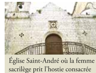
Église Saint-André où la femme sacrilège prit l'hostie consacrée