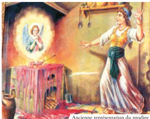
Ancienne représentation du prodige

Une femme de religion non chrétienne, ne croyait pas en la présence réelle de Jésus dans l'Eucharistie. Aidée par une de ses amies chrétiennes pendant la célébration d'une messe, elle réussit à voler une hostie consacrée. La femme, presque en défiant Dieu, mit la particule consacrée sur le feu dans une poêle pleine d'huile. Tout à coup, une grande quantité de sang jaillit de l'hostie en inondant le sol au point de couler sous la porte d'entrée de la maison.