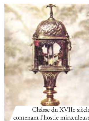
Châsse du XVIIe siècle contenant l'hostie miraculeuse