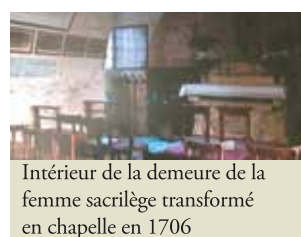
Intérieur de la demeure de la femme sacrilège transformé en chapelle en 1706