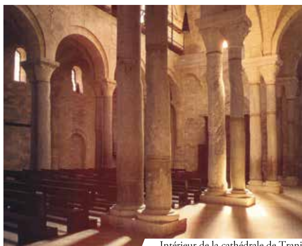
Intérieur de la cathédrale de Trani