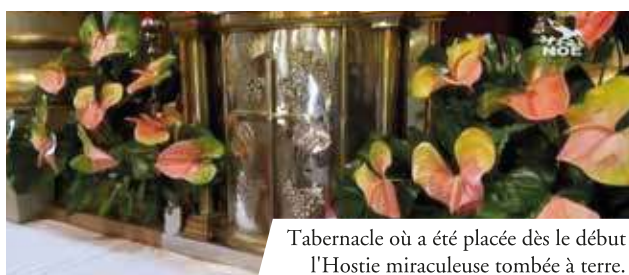
Tabernacle où a été placée dès le début l'Hostie miraculeuse tombée à terre.