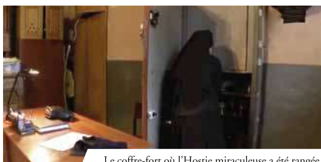
Le coffre-fort où l'Hostie miraculeuse a été rangée