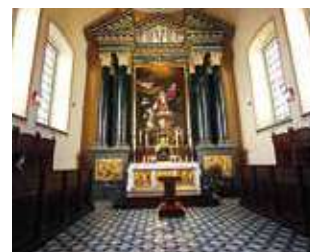
Intérieur de la chapelle où est conservée la précieuse Relique