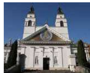
Église dédiée à Saint Antoine de Sokolka