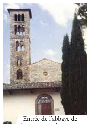
Entrée de l'abbaye de Sainte-Marie de Rosano