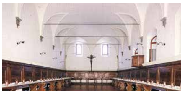
Le réfectoire de l'abbaye