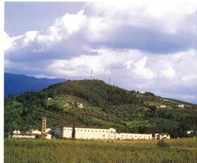
Selon une inscription du XVII e siècle sur la façade de l'église, l'abbaye de Sainte-Marie de Rosano fut fondée en 780