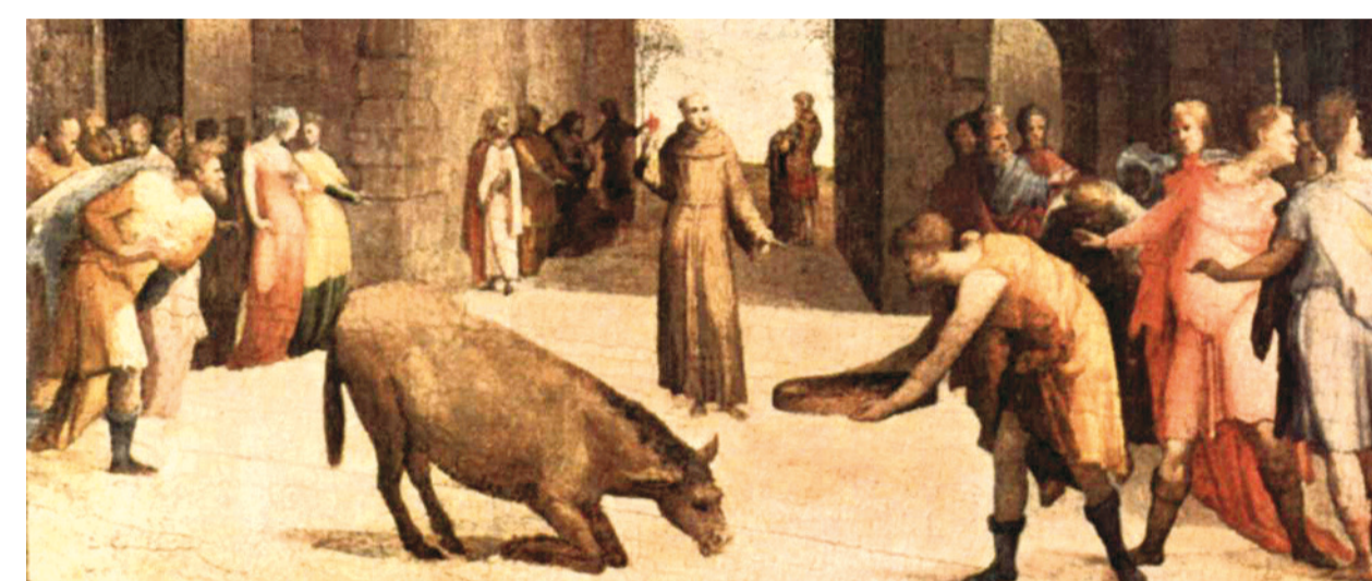
Domenico Beccafumi, saint Antoine et le miracle de la mule (1537), Louvre, Paris