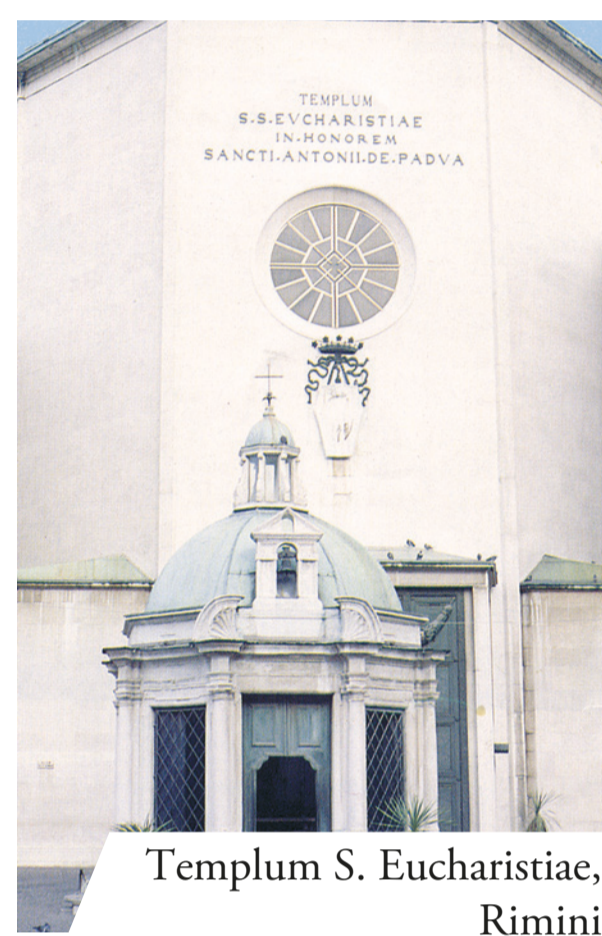
Templum S. Eucharistiae, Rimini