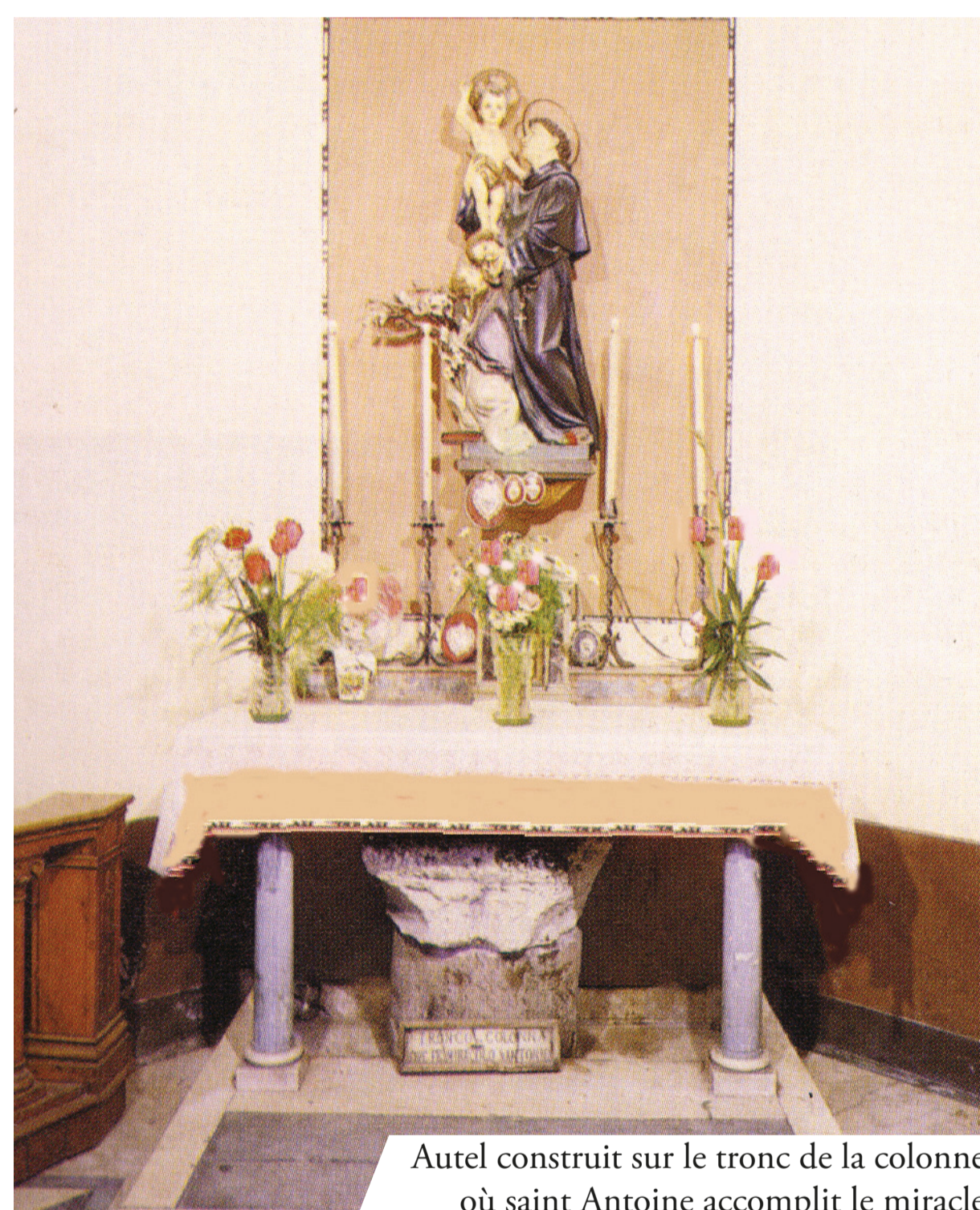
Autel construit sur le tronc de la colonne où saint Antoine accomplit le miracle