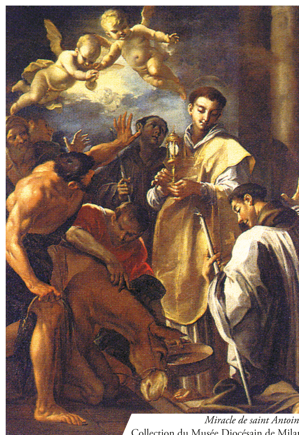
Miracle de saint Antoine Collection du Musée Diocésain de Milan

Dans la ville de Rimini, il est possible aujourd'hui encore, de visiter l'église érigée en mémoire du miracle eucharistique accompli par saint Antoine de Padoue en 1227. Cet épisode est cité aussi dans la Begninitas , oeuvre dont les sources sont parmi les plus anciennes de la vie de saint Antoine. « Ce saint homme discutait avec un hérétique cathare incrédule au sujet du sacrement de l'Eucharistie, alors que le saint l'avait presque converti à la foi catholique. »