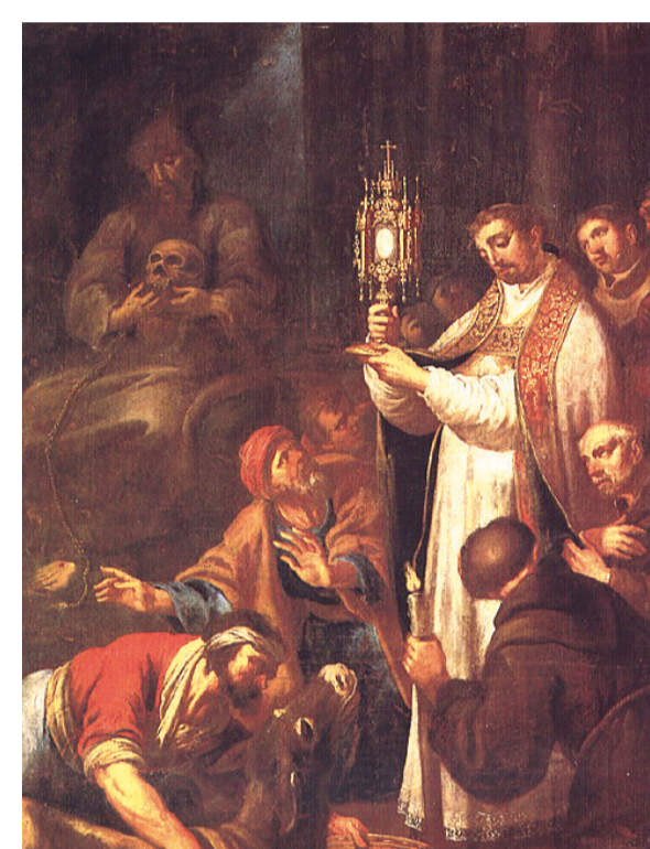
Miracle eucharistique de saint Antoine. Salvaterra de Magos, église Matriz, Portugal