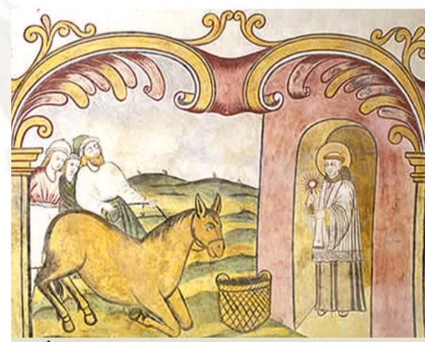
Église Saint-Antoine - Tonara