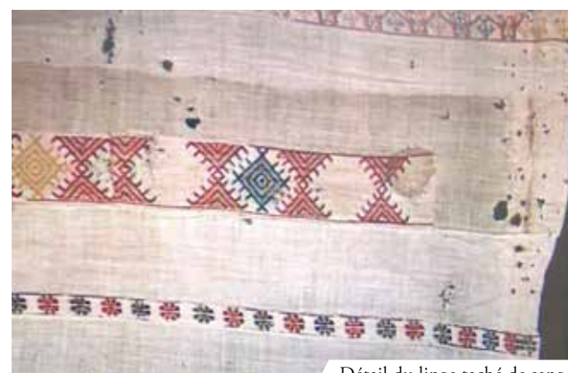
Détail du linge taché de sang