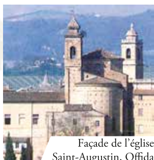
Façade de l'église Saint-Augustin, Offida