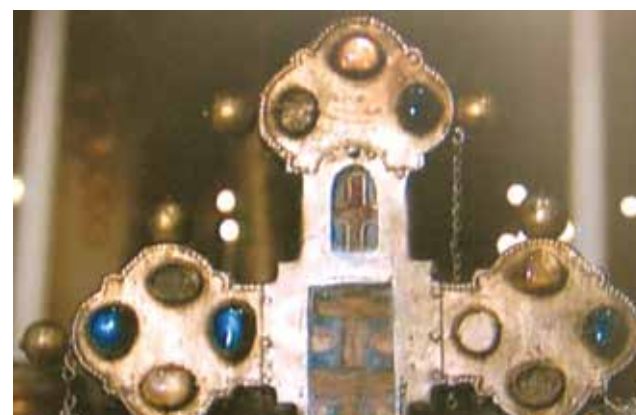
Image agrandie de la relique de l'hostie contenue dans cette précieuse croix, travail effectué par un orfèvre vénitien (XIII e siècle)

vre « qu'il ne révélerait à personne ce qu'il avait vu et déposé dans la croix ». L'orfèvre allait prendre le ciboire avec l'hostie miraculeuse, quand il fut saisi par une fièvre subite. Il s'exclama : « Que m'as-tu apporté, mon frère ? » Le religieux lui demanda s'il était en état de péché mortel. Comme l'orfèvre répondit que oui, il se confessa au religieux et la fièvre disparut. Sans aucun danger l'orfèvre prit alors le ciboire, en sortit l'hostie, la renferma dans la croix avec le bois sacré et posa par-dessus un cristal, comme on peut clairement le voir. Les reliques de la jarre et de la nappe tachée de sang avec la croix contenant l'hostie miraculeuse, sont exposées dans l'église Saint-Augustin à Offida. La maison de Ricciarella à Lanciano a été transformée en chapelle. En 1973, a été célébré le VII e centenaire du miracle. Chaque année, le 3 mai, les habitants de Offida fêtent l'anniversaire du miracle.