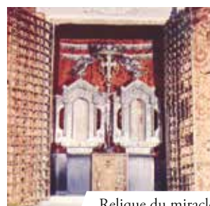
Relique du miracle