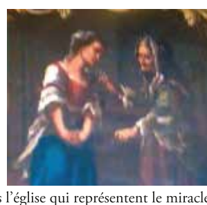
Fresques dans l'église qui représentent le miracle