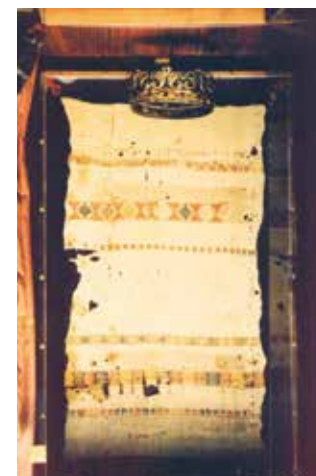
Relique de la serviette en lin ensanglantée dans laquelle Ricciarella enveloppa l'hostie miraculeuse