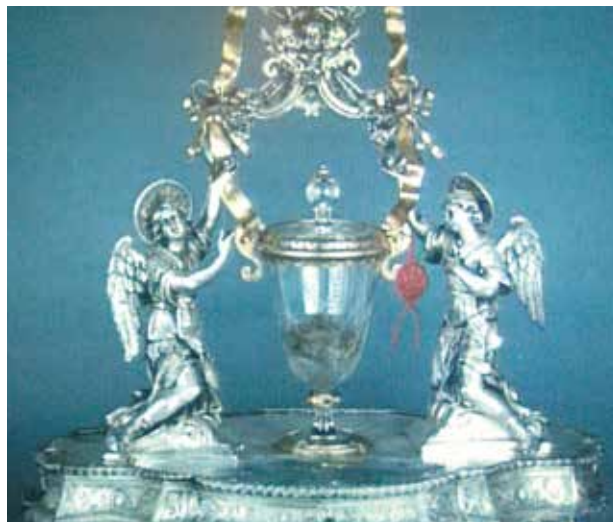
Le reliquaire du XVIII e siècle contenant l'hostie et le sang coagulé, don munificent de Domenico Coli.

Le miracle fut l'objet de plusieurs vérifications de la part des autorités de l'Église, entre 1574 et 1886. En 1970, il fut soumis à un examen scientifique de la part des professeurs de l'Université de Sienne qui conclurent : « La chair est de la véritable chair humaine (composée par un tissu musculaire du cœur); le sang est du vrai sang (appartenant au même groupe sanguin AB que la chair); les substances sont celles du tissu humain, normales et fraîches : la conservation de la chair et du sang, laissés à l'état naturel pendant douze siècles et exposés à l'action des agents atmosphériques et biologiques, reste un phénomène extraordinaire. » Relation Linoli 41311971