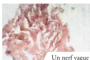
Un nerf vague