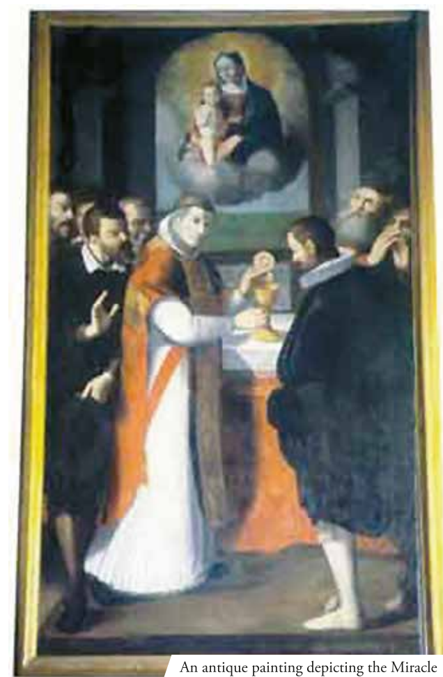
An antique painting depicting the Miracle