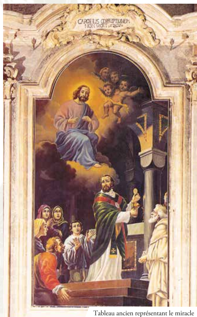
Tableau ancien représentant le miracle