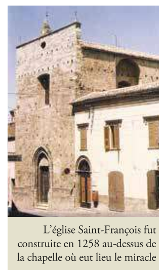
L'église Saint-François fut construite en 1258 au-dessus de la chapelle où eut lieu le miracle