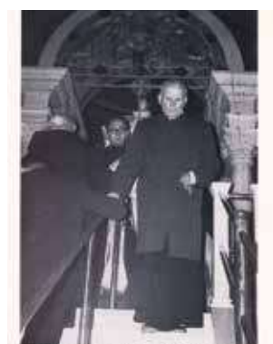
Il Sommo Pontefice Giovanni Paolo II allora Cardinale di Genova davanti alla Ss. Reliquia, con espone la Sua devotissima. 3.27.1979