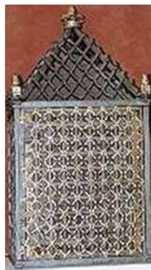
Grille en forme de cube en fer forgé doré où furent conservées les reliques pendant environ 266 ans.