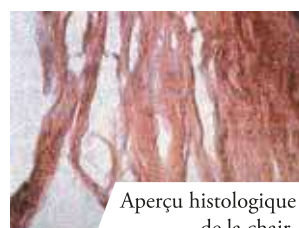
Aperçu histologique de la chair.