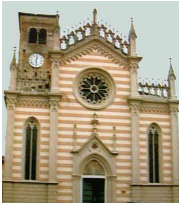
Dans l'église du Très Saint Corps du Christ à Valvasone on conserve la nappe de lin ensanglantée

Parmi les témoignages dignes de foi figure celui de l'historien Antonio Nicoletti (1765) décrivant le miracle eucharistique qui s'est accompli à Gruaro. Une femme qui faisait la lessive des nappes d'autel au lavoir du village, le long du canal Versiola, vit tout à coup une nappe se teinter de sang. En observant plus attentivement, elle remarqua que le sang sortait d'une parcelle d'hostie restée dans les plis de la nappe.