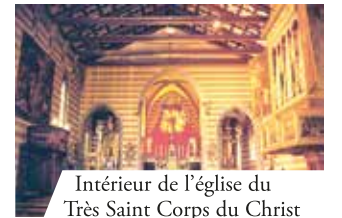
Intérieur de l'église du Très Saint Corps du Christ