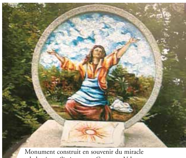
Monument construit en souvenir du miracle et de la réconciliation entre Gruaro et Valvasone