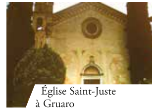
Église Saint-Juste à Gruaro