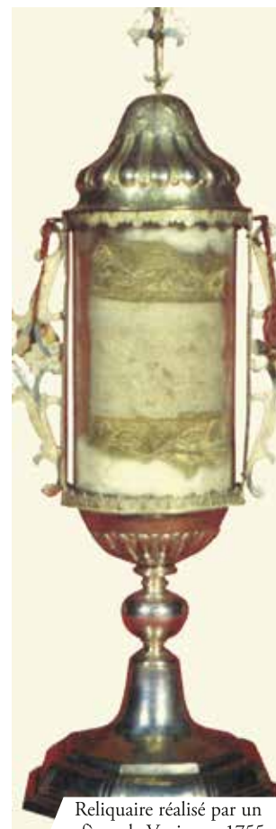
Reliquaire réalisé par un orfèvre de Venise en 1755