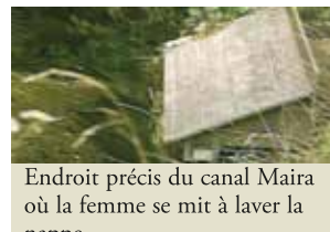
Endroit précis du canal Maira où la femme se mit à laver la nappe