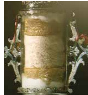
Détail du corporal