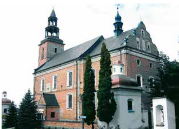
Sanctuaire eucharistique de Glotowo