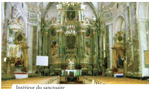
Intérieur du sanctuaire

En 1290, les troupes lituaniennes envahirent la Pologne et le curé du village de Glotowo décida de cacher à l'écart dans une prairie le ciboire d'argent dans lequel était restée par mégarde une hostie consacrée. Mais aucun des survivants n'avait entendu parler de l'hostie cachée. Ce n'est que quelques années plus tard, pendant un labour de printemps, qu'un paysan la retrouva par hasard, suite à un comportement bizarre de ses bœufs. Ces derniers s'étaient inclinés pour adorer l'hostie d'où jaillissait une lumière très forte.