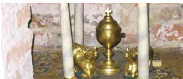
Ciboire contenant la relique de l'hostie prodigieuse. Sur les côtés, sont représentés les bœufs qui s'agenouillèrent dans le champ pour adorer l'hostie