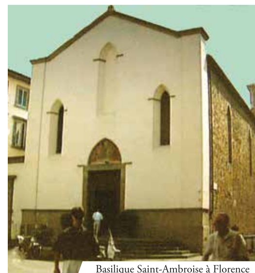
Basilique Saint-Ambroise à Florence