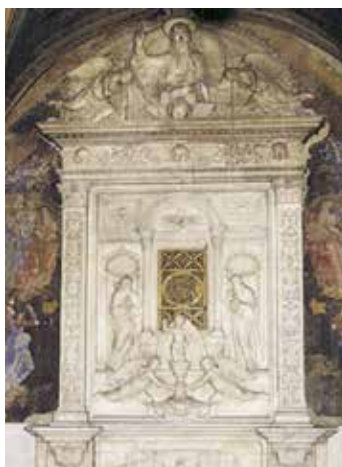
Tabernacle précieux de Mino da Fiesole où sont conservées les reliques des deux miracles