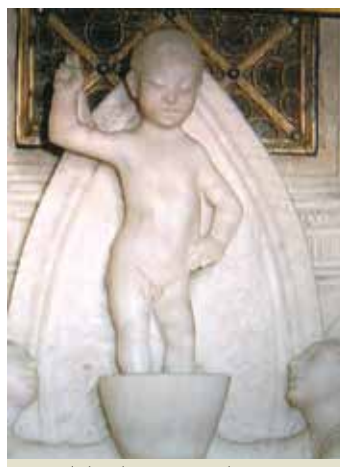
Détail des décorations du tabernacle où l'on conserve les reliques des deux miracles eucharistiques