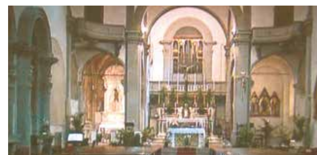
Intérieur de la basilique Saint-Ambroise

Le premier miracle eut lieu en 1230. Le prêtre nommé Guccione, après avoir fini de célébrer la messe, ne s'aperçut pas que quelques gouttes de vin consacré étaient restées dans le calice et se transformèrent en sang. L'historien Giovanni Villani fit une description scrupuleuse du miracle. « Le jour suivant en prenant le même calice il y trouva du sang coagulé. Il fut montré à toutes les femmes du monastère et à tous les voisins présents, à l'évêque, au clergé, puis à tous les Florentins. Ceux-ci avec une grande dévotion se rassemblèrent pour constater le prodige, ils prirent le sang du calice et le mirent dans une burette de cristal qui est encore montrée au peuple avec grand respect. » L'évêque Ardingo de Pavie ordonna de porter la relique à l'évêché et après quelques semaines la rendit aux