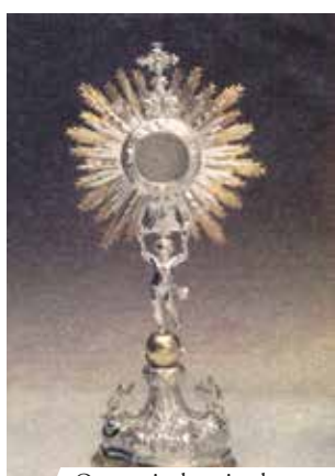
Ostensoir du miracle