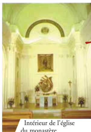
Intérieur de l'église du monastère