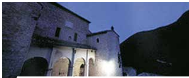
Hermitage de Fonte Avellana où vécut Saint Pierre Damien

Saint Pierre Damien, docteur de l'Église, décrit « Opuscul, XXXIV ; Patrol. lat., tom. CXLV, col. 573 » un important miracle eucharistique dont il fut le témoin direct. Nous citons la traduction italienne de l'épisode comme le saint même la décrit : « Il s'agit d'un événement eucharistique de grande importance. Il advint en 1050. Une femme cédant à des suggestions diaboliques, était en train d'emporter chez elle le pain eucharistique pour s'en servir comme maléfice, quand un prêtre s'en aperçut. Il la suivit et lui enleva le butin sacrilège. Il déroula le linge où était enveloppée la sainte hostie et s'aperçut qu'elle s'était transformée de telle façon qu'une moitié était devenue visiblement le corps du Seigneur alors que l'autre avait l'aspect d'une hostie normale. Par un témoignage aussi évident, Dieu a voulu vaincre l'incrédulité et l'hérésie de ceux qui refusaient d'accepter la présence réelle dans le mystère eucharistique : dans la moitié du pain consacré, le Corps du Seigneur était visible, laissant à l'autre sa forme naturelle. Ceci pour mieux rendre la réalité de la transsubstantiation sacramentelle qui s'accomplit dans la consécration ».