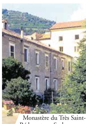
Monastère du Très Saint-Rédempteur, Scala