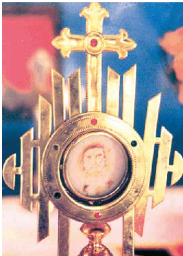
L'ostensoir contenant l'hostie sur laquelle le visage est apparu