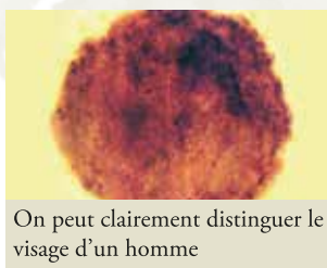
On peut clairement distinguer le visage d'un homme