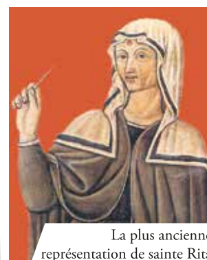
La plus ancienne représentation de sainte Rita

Dans un document de 1687 reconnaissant l'authenticité de la relique du miracle eucharistique de Cascia, et appartenant aux Religieux Augustins, sont ajoutées de précieuses informations relatives à ce miracle. Il est dit que depuis 1837, les habitants de Cascia portaient en procession les reliques du miracle eucharistique, chaque année le jour de la Fête-Dieu. En 1930, à l'occasion du sixième centenaire de l'événement, on célébra à Cascia un congrès eucharistique pour tout le diocèse de Norcia ; on publia la documentation historique de l'événement et un précieux ostensor artistique fut inauguré.