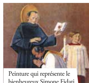
Peinture qui représente le bienheureux Simone Fidati