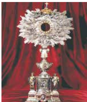
Ancien ostensor qui contenait la relique du miracle