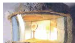
Tabernacle du miracle eucharistique