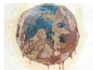
Agrandissement de la reproduction du visage apparu sur la page de gauche