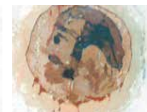
Agrandissement de la reproduction du visage apparu sur la page de droite