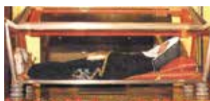
Châsse contenant le corps de sainte Rita