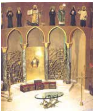
Basilique supérieure avec presbytère du sculpteur Manzù