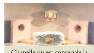
Chapelle où est conservée la relique dans la basilique inférieure