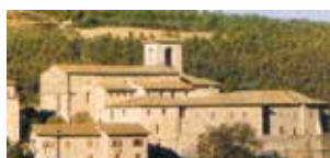
Couvent Saint-Augustin à Cascia