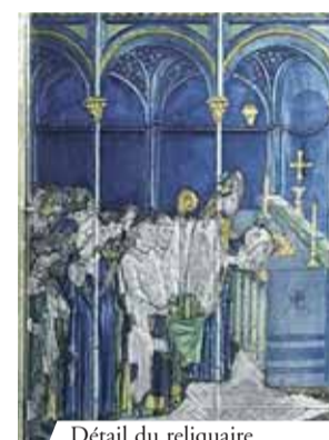
Détail du reliquaire