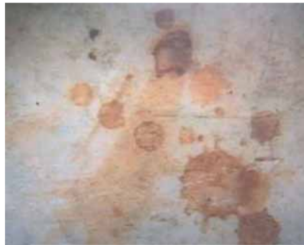
Détail de la pierre tachée de sang, Bolsena