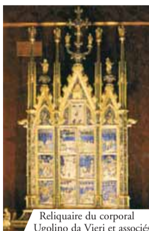
Reliquaire du corporal Ugolino da Vieri et associés (1338) Orvieto