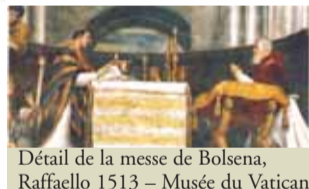
Détail de la messe de Bolsena, Raffaello 1513 - Musée du Vatican