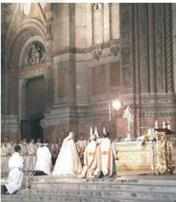
Adoration publique en l'honneur de la fête du Corpus Domini - Orvieto