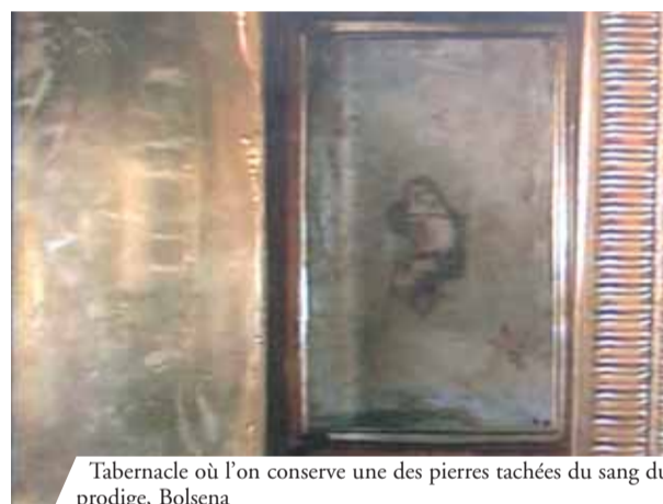
Tabernacle où l'on conserve une des pierres tachées du sang du prodige, Bolsena