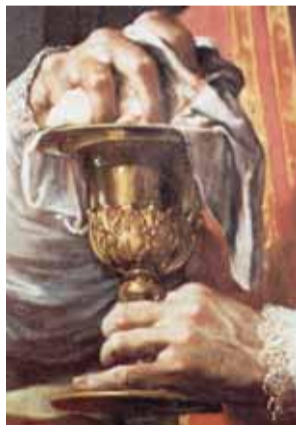
Francesco Trevisani - Détail du miracle de Bolsena