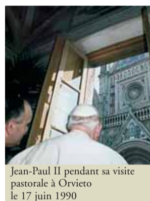
Jean-Paul II pendant sa visite pastorale à Orvieto le 17 juin 1990