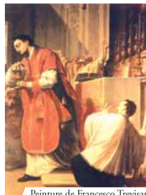
Peinture de Francesco Trevisani