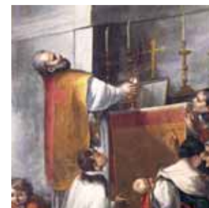
Peinture représentant la messe de Bolsena de Francesco Robbio - Collection du Musée Diocésain de Milan