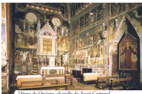
Dôme de Orvieto, chapelle du Sacré Corporal