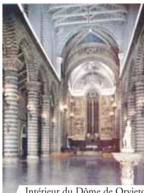
Intérieur du Dôme de Orvieto