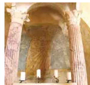
Église Sainte-Christine à Bolsena – Autel sur lequel eut lieu le miracle