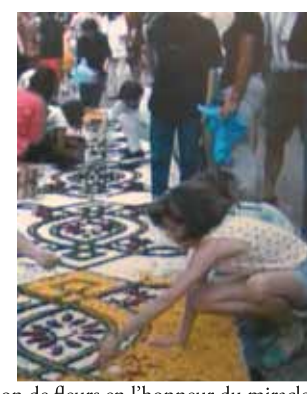
Exposition de fleurs en l'honneur du miracle