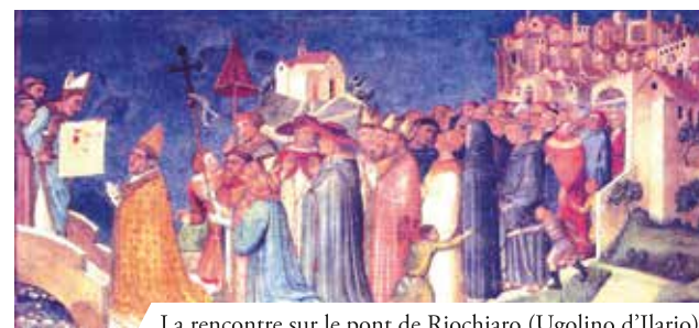
La rencontre sur le pont de Riochiaro (Ugolino d'Ilario)