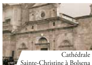
Cathédrale Sainte-Christine à Bolsena