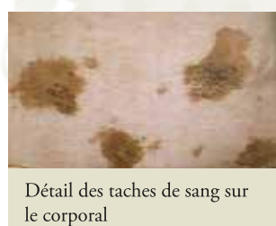
Détail des taches de sang sur le corporal