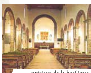
Intérieur de la basilique