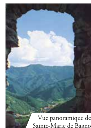
Vue panoramique de Sainte-Marie de Bagno