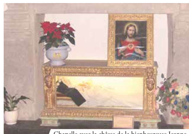
Chapelle avec la châsse de la bienheureuse Jeanne

On conserve à Bagno di Romagna dans l'église de l'Assomption le « linge sacré taché de sang ». L'historien Fortunio dans son œuvre Annales Camaldulenses décrit ainsi le miracle qui en est à l'origine : « C'était en l'année 1412. L'abbaye de Sainte-Marie de Bagno (alors prieuré) était dirigée par le père Lazzaro, d'origine vénitienne. Un jour, pendant qu'il célébrait le sacrifice divin, son esprit fut diaboliquement occupé par un fort doute sur la présence réelle de Jésus dans le Saint-Sacrement. Soudain il vit les saintes espèces du vin bouillonner, déborder du calice et se répandre sur le corporal sous la forme de sang frais et battant. Si bien que le corporal en fut imbibé. Inutile de dire l'émotion du prêtre, et combien son esprit fut perturbé par cet événement extraordinaire. Il s'adressa aux fidèles présents en larmes en leur confessant son manque de foi et