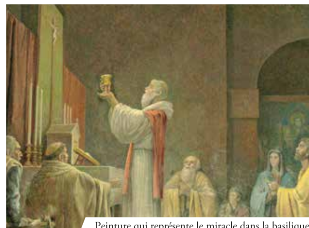
Peinture qui représente le miracle dans la basilique