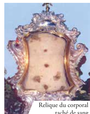
Relique du corporal taché de sang