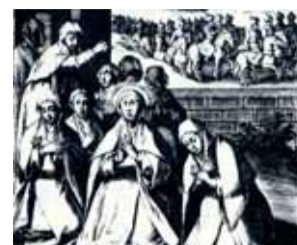
Enrico de Vroom (1587) - miracle de sainte Claire