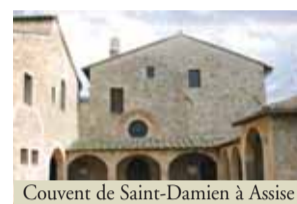
Couvent de Saint-Damien à Assise