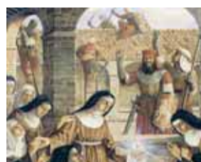
Sainte Claire et les Sarrasins – Piero Casentini, Couvent de Santa Croce – Pignataro Maggiore V