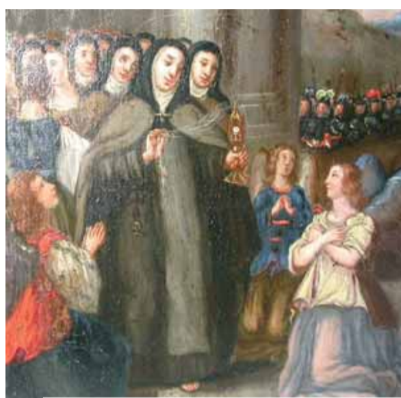
Ancienne peinture du miracle de sainte Claire