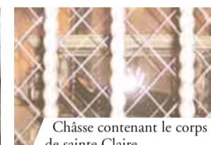
Châsse contenant le corps de sainte Claire