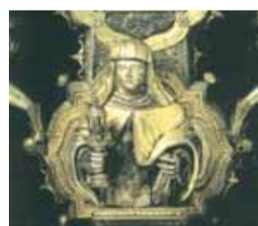
Sainte Claire – Détail de la Grande Croix de Gianfrancesco dalle Croci